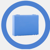
Bleu Pastel 010